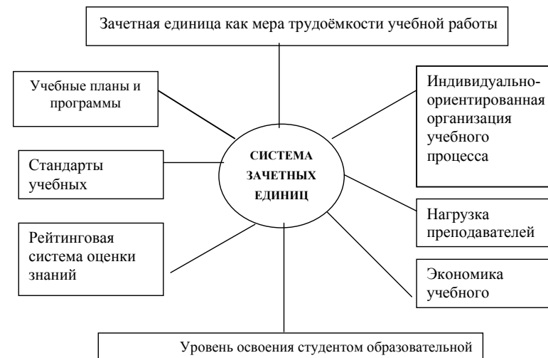
Схема 6. Роль системы зачетных единиц в учебном процессе.

Зачетная единица выступает не просто как оценка в других терминах, а как мера трудоёмкости учебной работы. Связь с составляющими учебного процесса представлена на схеме 5.